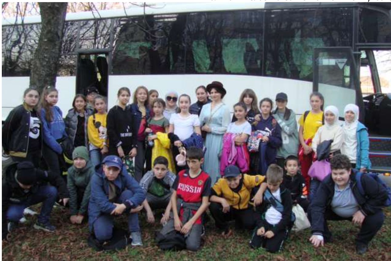
Владикавказ «Ледовая арена»