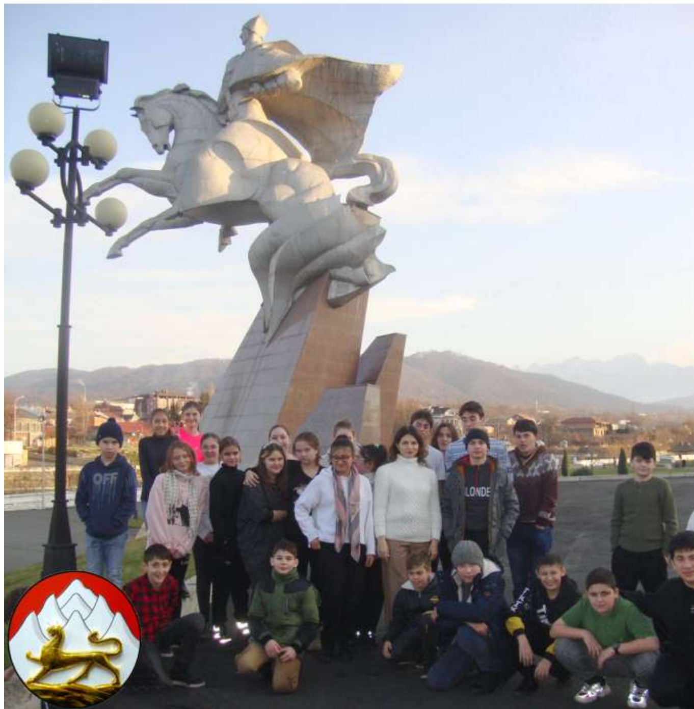
Памятник знаменитому генералу, уроженцу Осетии, дважды герою Советского Союза - Иссе Плиеву

Эльхотовских ворот были представители многих братских советских народов, проявившие образцы преданности Родине и солдатского мужества.